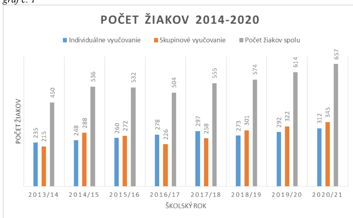
graf č. 1

Poznámka: v tabuľke č.1 sú počty žiačok/žiakov v ZUŠ v individuálnej forme vyučovania a v skupinovej forme vyučovania. Spodný riadok udáva celkový počet žiačok/žiakov v jednotlivých školských rokoch.